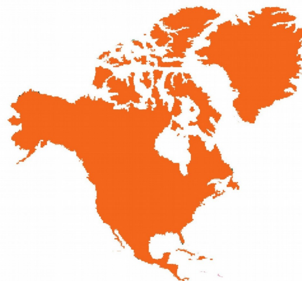
Amérique du Nord