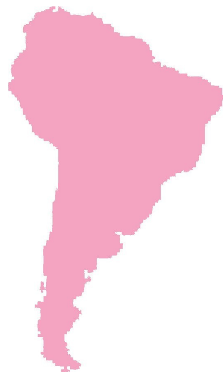
Amérique du Sud