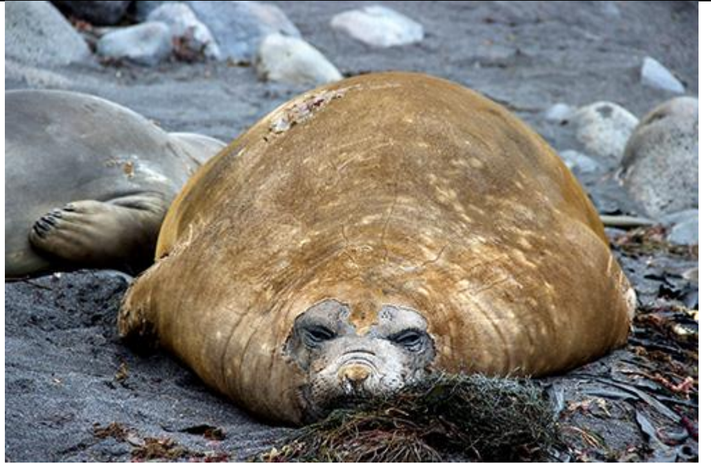
éléphant de mer