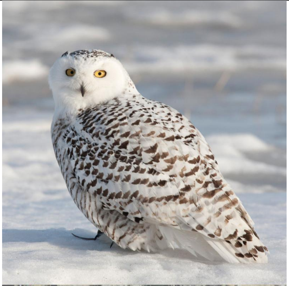
harfang des neiges