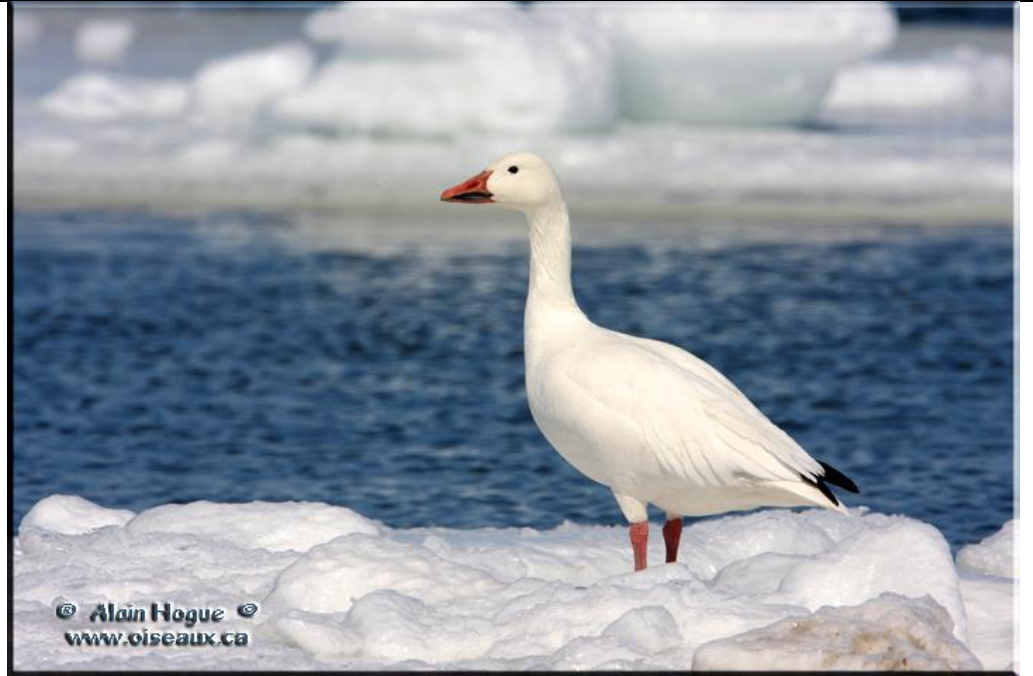
oie des neiges