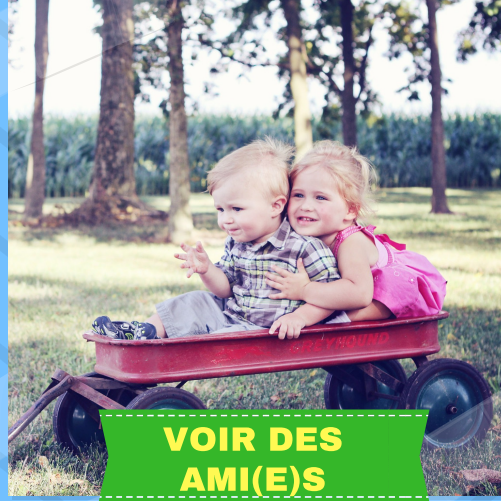
VOIR DES AMI(E)S